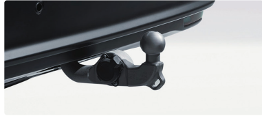
Elektrisk utplasserbar tilhengerfeste