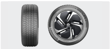
Piggfriedekk komplett sett 20"