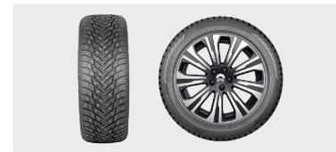
Piggdekk komplett sett 21"