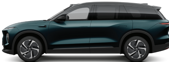
LANSERINGSFARGE: NEBULA GREEN