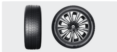
Piggfriedekk komplett sett 21"