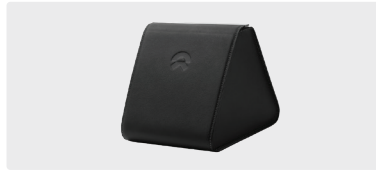
Triangle Storage Box