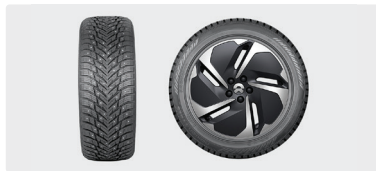
Piggdekk komplett sett 20"