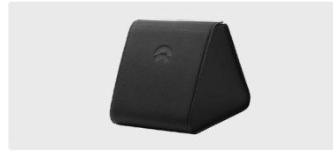
Triangle Storage Box