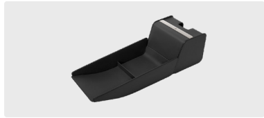
Central Storage Tray