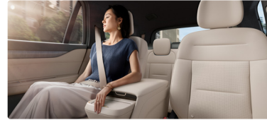
Premium Comfort Package (beim EL8 Executive inkludiert)