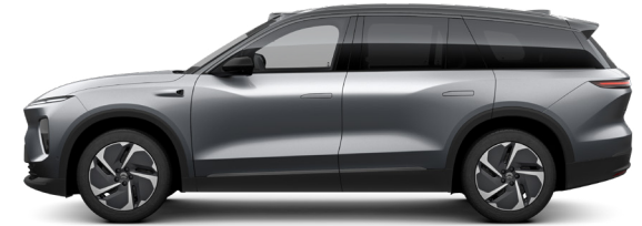
NEW MOON SILVER